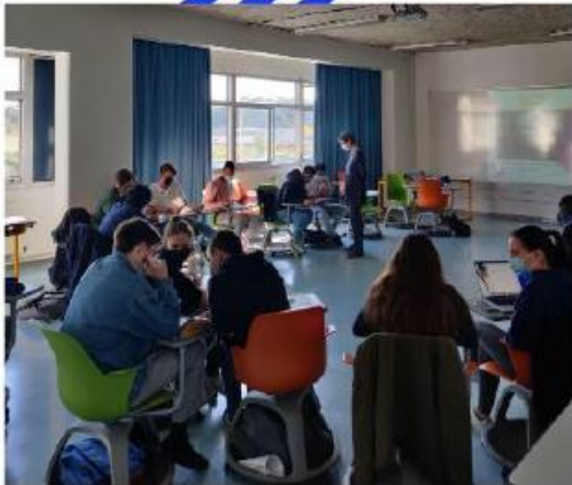
Interventions : Geres, ONPE, Enerplan, CPIE