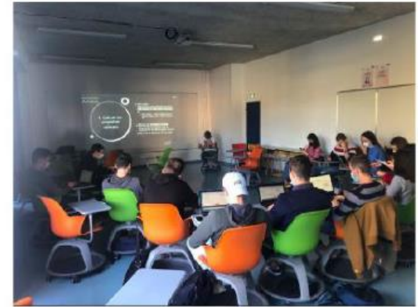
Ateliers Empreinte Carbone et Quizz sur la Précarité Énergétique